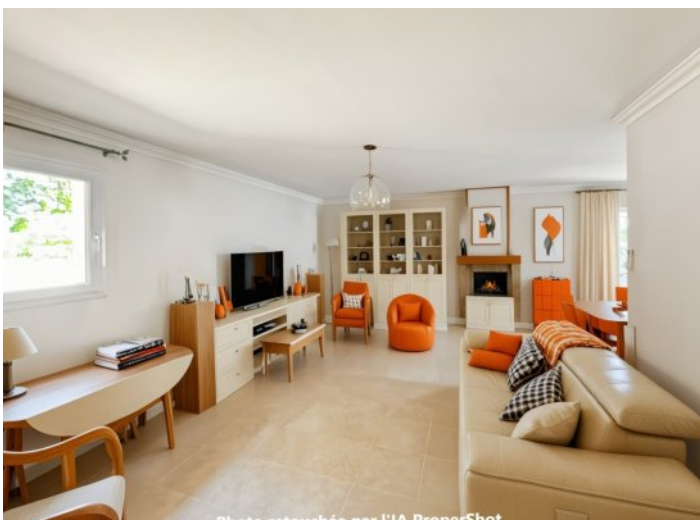
Photo retouchée par l'IA ProperShot