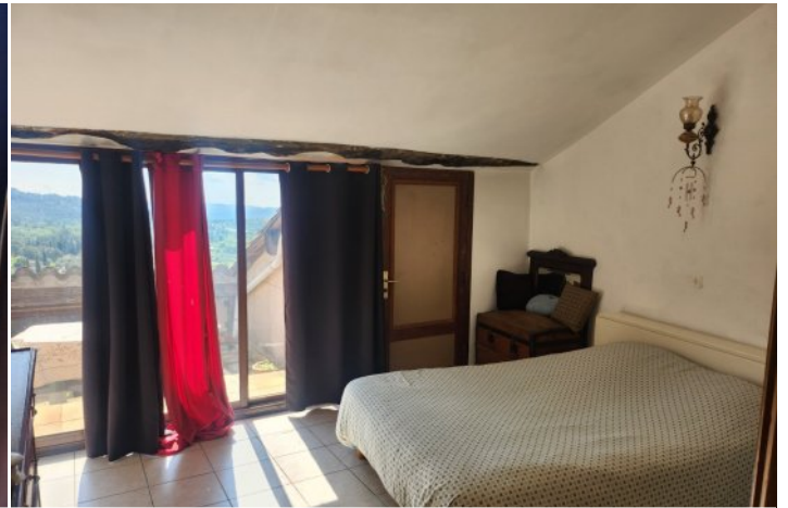
CHAMBRE VERS TERRASSE