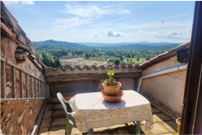
TERRASSE COOIN REPAS 6 PERSONNES