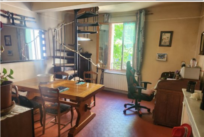
SALLE A MANGER